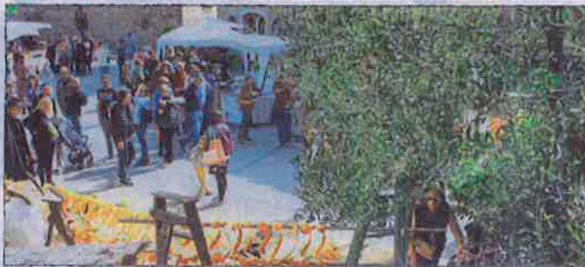
Comme jadis, les colannes, de longs rubans d'oranges, sèchent au soleil.

Du côté des animations chacun a pu se satisfaire, certains auprès du bar à parfum avec Voyage en terre de parfum pour composer son