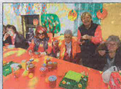
Le jury du concours de confitures d'oranges amères en plein test.