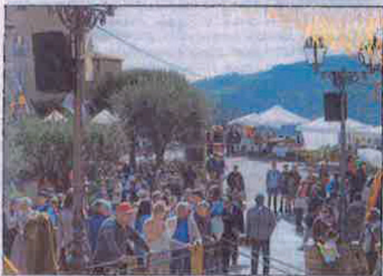
Le village a reçu plusieurs milliers de visiteurs tout au long de la journée.