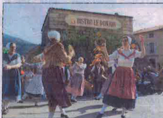
Les chants et musiques provençaux avec la formation Ici Messuglié.