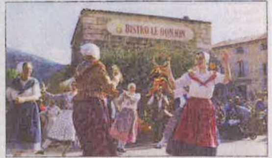
On n'échappe pas à la tradition des colannes, ces serpentins d'écorces d'oranges amères. À droite, musiques et danses traditionnelles seront au programme.

cours de vin d'orange et à 17 heures remise des prix.